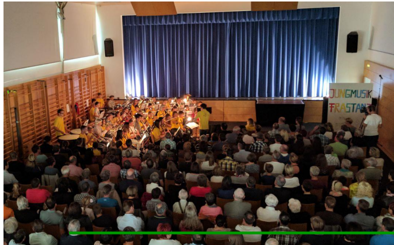
Bereit für den großen Moment