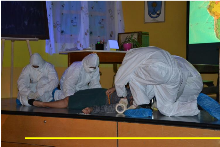
Die Spurensicherung bei der Arbeit