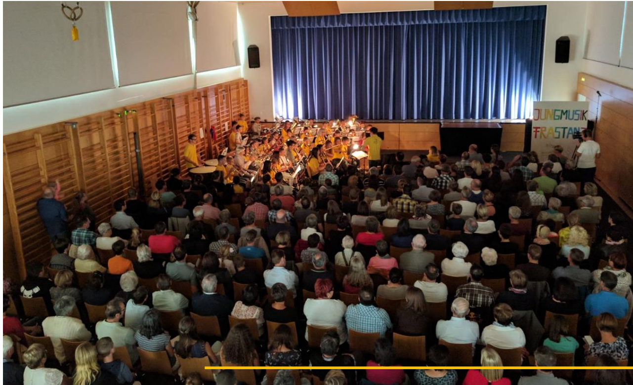
Ein voller Gemeindesaal

Aus der ursprünglichen Idee das Theaterstück aus 1997 nochmals aufzuführen, hat sich ein riesiges Projekt entwickelt. Die Kinder und Jugendlichen hatten immer mehr neue Vorstellungen, die das Projekt größer machten.