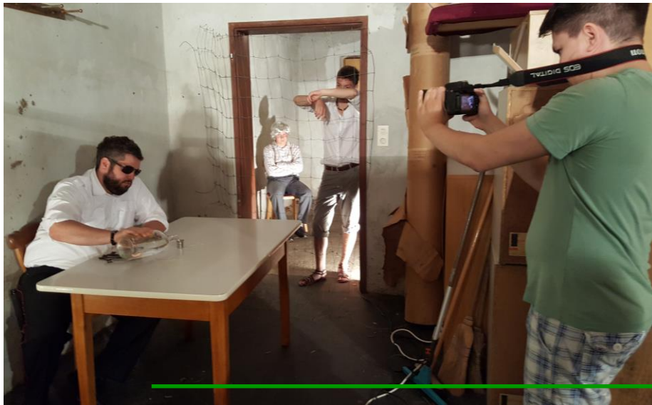
Im dreckigsten Bunker der Stadt