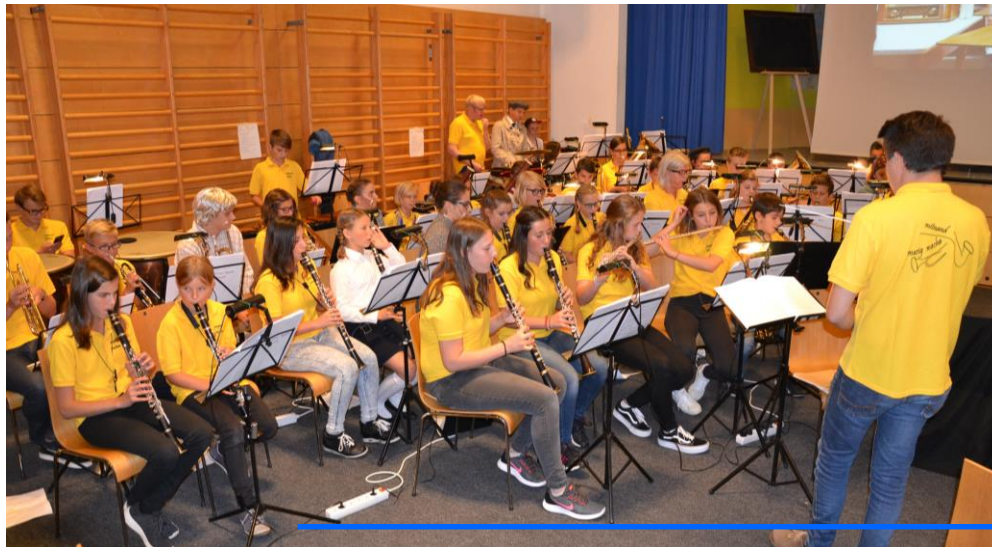
Das großartige Orchester