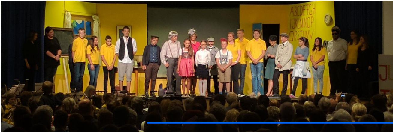
Ein gelungenes Projekt

Besonders erwähnenswert sind der Zusammenhalt und die Gemeinschaft in der Gruppe. Der große Altersunterschied und die verschiedenen Kulturen in einer Gruppe sind oft schwierige Hürden, die es zu überwinden gilt. Durch das Theater haben wir gezeigt, dass wir alle nur Menschen und von Grund auf gleich sind. Weiters konnten wir zeigen, dass jeder andere Talente mitbringt und wenn diese richtig genutzt werden, ein großes Projekt gelingen kann.