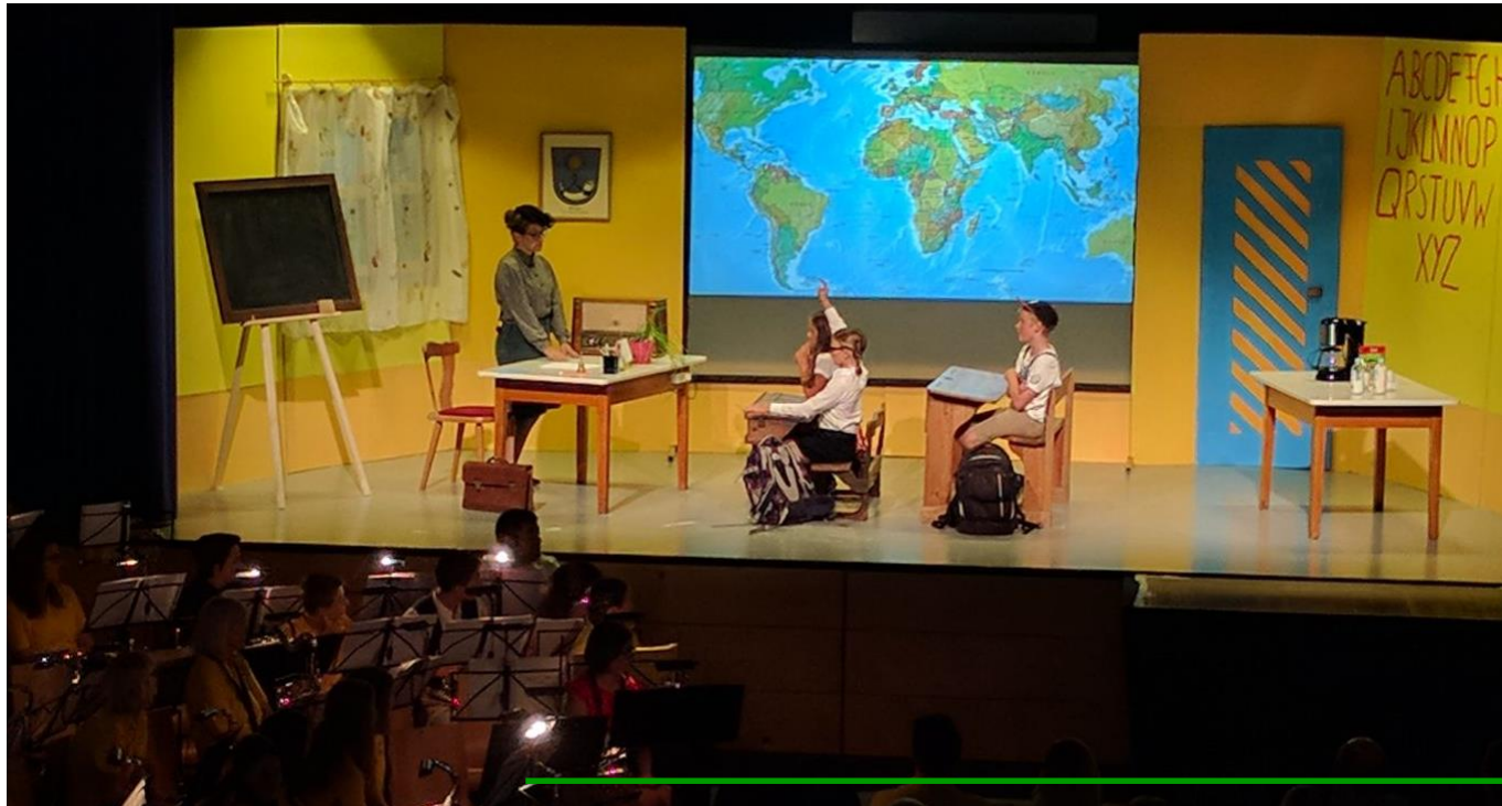
Ein wunderschöner Gesamteindruck

Es war uns sehr wichtig, dass alle Jungmusikanten Teil des Projektes sind, egal mit welchem Talent und in welcher Form. Jeder einzelne war ein Teil von dem großen Ganzen.