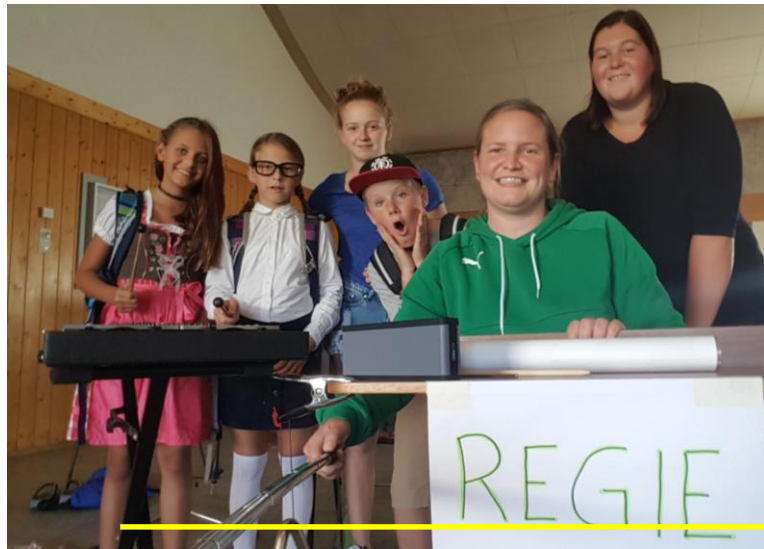
Beginn der Schauspielproben