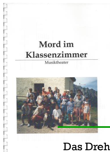
Das Drehbuch aus Jahre 1997

Das Stück wurde komplett überarbeitet und neu geschrieben, neue Szenen wurden eingebaut, Videosequenzen gedreht und eingearbeitet und ein Bühnenbild entworfen. Im Sommer 2017 wurde das ganze Theater fleißig einstudiert. Zusätzlich wurden passende Musikstücke ausgewählt und innerhalb einer Woche im Jungmusiklager einstudiert.