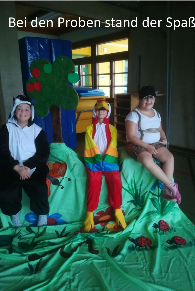
Bei den Proben stand der Spaß und die Freude der Kinder im Vordergrund