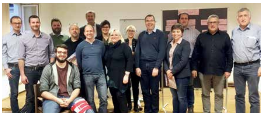
Gemeinsame Arbeit im Vereinswesen verbindet – einige Teilnehmer von Vereinsfit.Tirol.

Ganztages teilnehmen. Alle Module waren aber durch einen roten Faden miteinander verknüpft. Damit bot man eine umfassende Führungsausbildung für Funktionäre und solche, die es noch werden wollten, an. Besonders bewährte sich das verbandsübergreifende Arbeiten. Zudem wurden viele neue Bekanntschaften geschlossen. Das Fortbildungsprogramm wird 2019 fortgeführt.