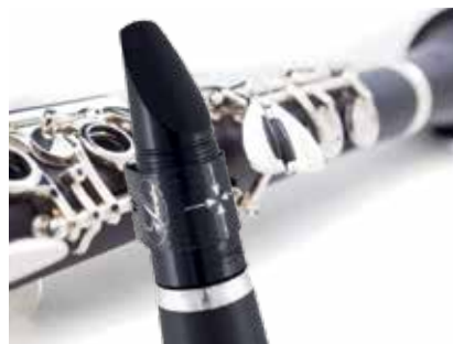
Do., 14. März 2019, 10 – 19 Uhr KLARINETTEN-SERVICE-TAG mit W. Schreiber-Produktspezialisten