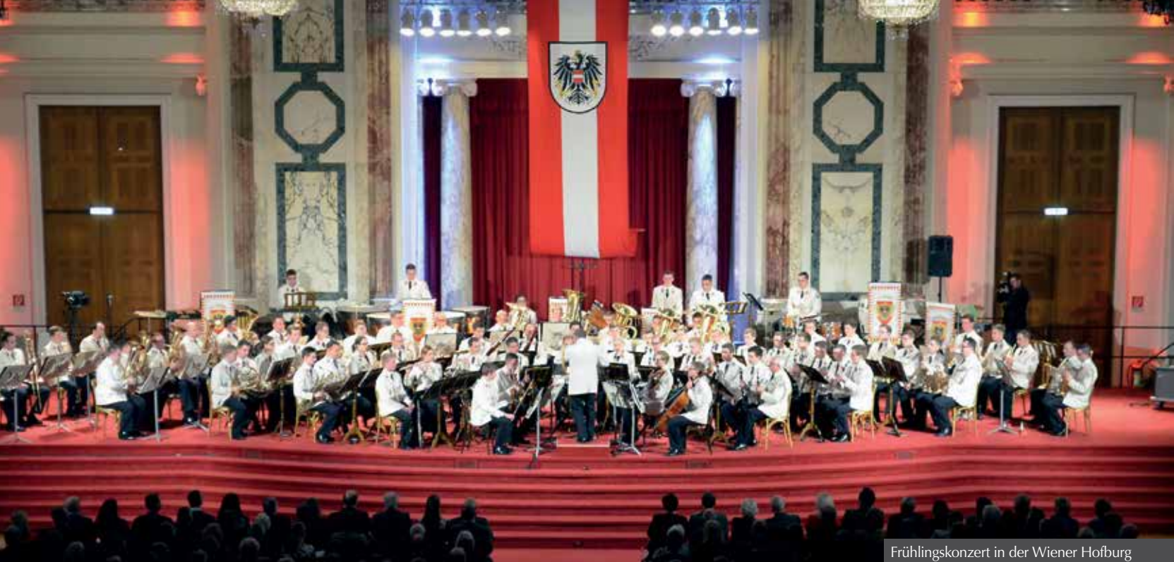
Frühlingskonzert in der Wiener Hofburg