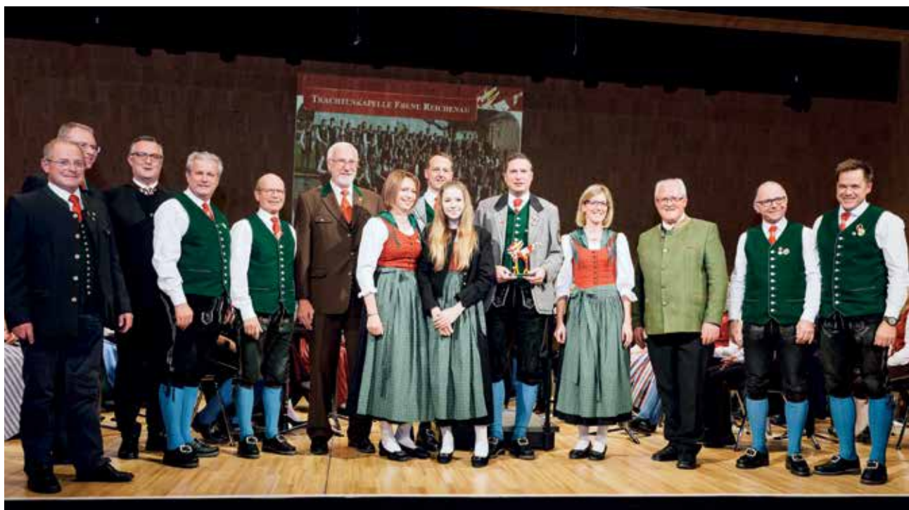
Der Rudolf-Kummerer-Würdigungspreis für einen besonders würdigen Musikverein ging an die TK Ebene Reichenau.