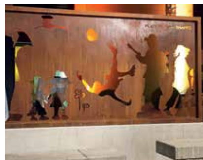
Paul Mühlbauer schuf das Kunstwerk, das die verschiedenen Bereiche des Ehrenamts darstellt.

zu widmen. Er dankte dabei den zahlreichen Freiwilligen für ihr unbezahlbares Engagement und dem südburgenländischen Künstler Paul Mühlbauer für das Kunstwerk, das die verschiedenen Bereiche des Ehrenamts am Platz vor dem neuen Landhaus darstellt.