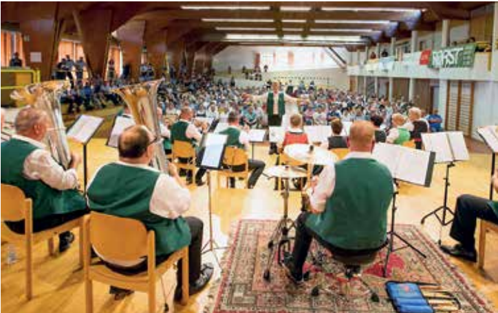
Der Wettbewerbssaal aus der Sicht der Siegerkapelle: ein wunderbarer Saal, mit 450 Personen voll besetzt. Besser geht's kaum.

solistisch geprägten Programm eine sensationelle Leistung. „Wir hatten bis zu 70.000 Zuhörer bei diesem Radio-Frühscoppen. Summa summarum sind wir sehr zufrieden mit dem diesjährigen Festival“, betont Organisator Rainer Stiasny.