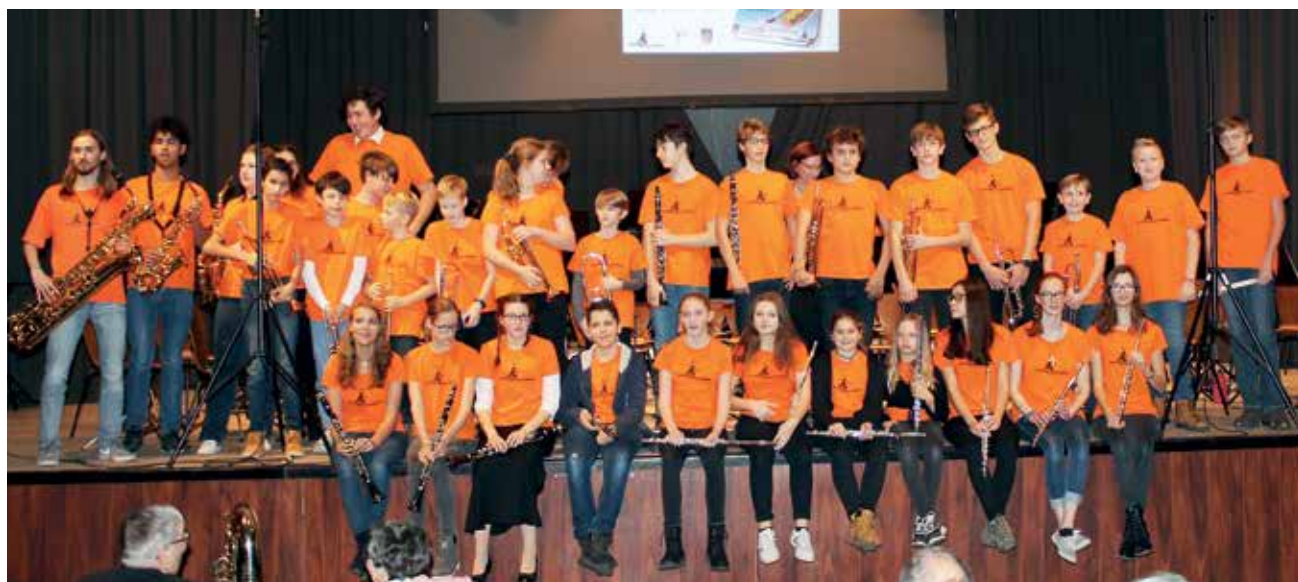
Die Orange Corporation präsentierte drei Stücke.