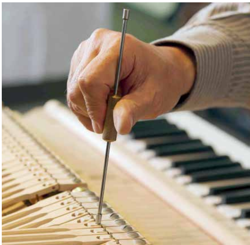
Ein Klavier zu stimmen, ist keine künstlerische Tätigkeit.

Verwaltungsgerichtshof 7. 6. 1983 (Recht der Wirtschaft 1983, 31) ■