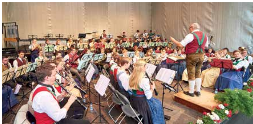
Aufführung im Rahmen der Innsbrucker Promenadenkonzerte