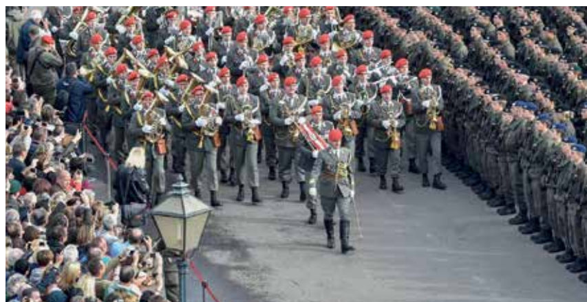
Angelobung am Nationalfeiertag

Während der Ballsaison präsentiert es sich, meist gemeinsam mit der Big