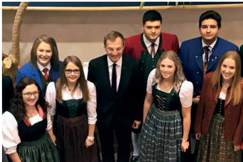
Verleihung der JMLA in Gold durch Landeshauptmann Mag. Thomas Stelzer