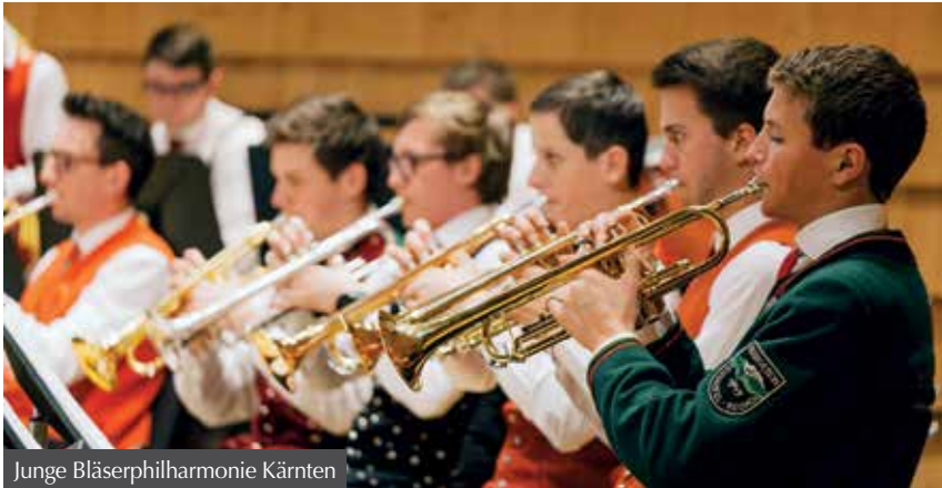
Junge Bläserphilharmonie Kärnten

jährige gute Leistungen bei Konzert- und Marschwertungen, die Teilnahme an oder die Organisation von überregionalen Veranstaltungen und besondere Jugendaktivitäten. „Wir sind sehr stolz, als erste Kapelle diesen Würdigungspreis erhalten zu haben“, betonen die Musiker der TK Ebene Reichenau.