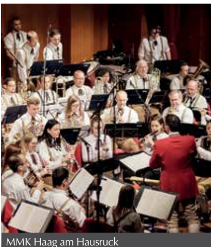
MMK Haag am Hausruck