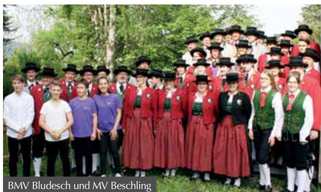
BMV Bludesch und MV Beschling