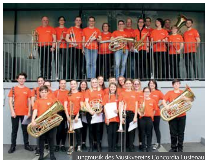
Jungmusik des Musikvereins Concordia Lustenau