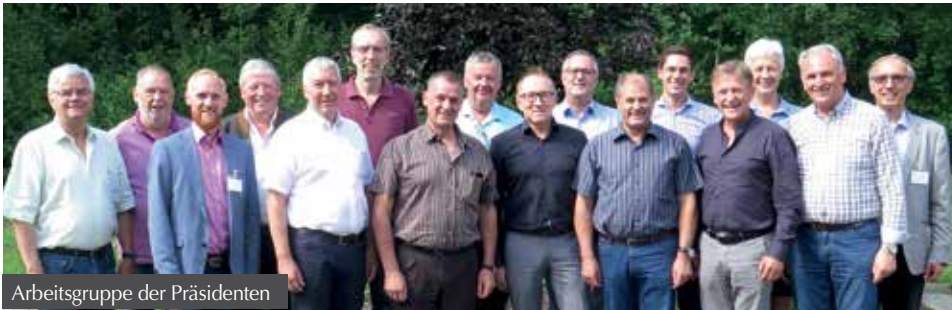
Arbeitsgruppe der Präsidenten