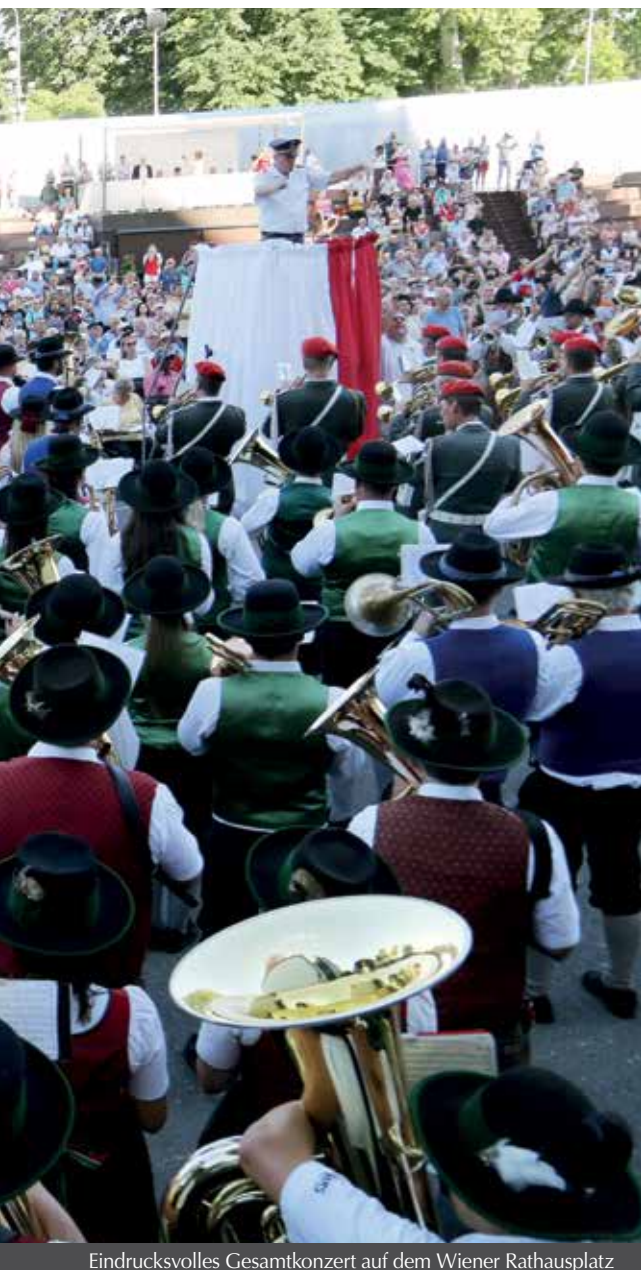
Eindrucksvolles Gesamtkonzert auf dem Wiener Rathausplatz