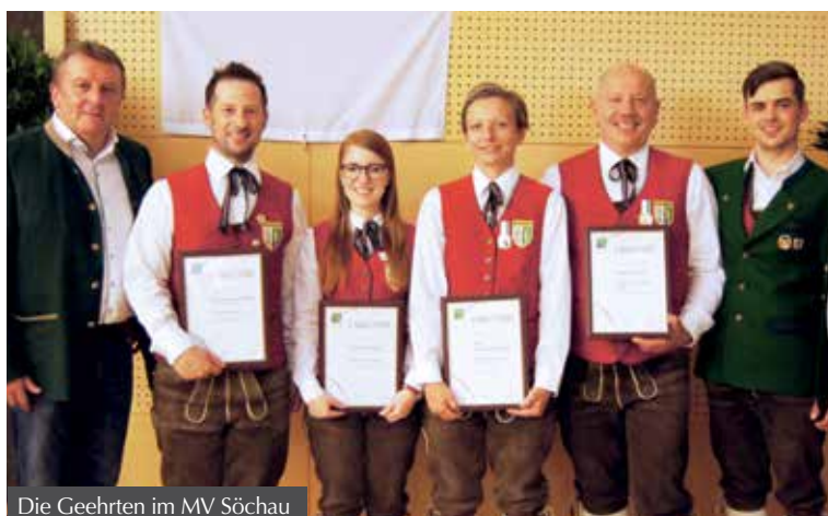
Die Geehrten im MV Söchau