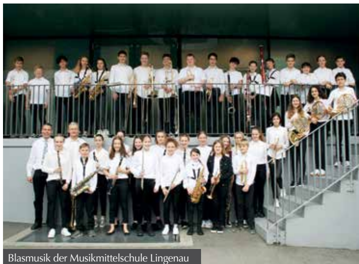
Blasmusik der Musikmittelschule Lingenau