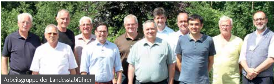
Arbeitsgruppe der Landesstabführer