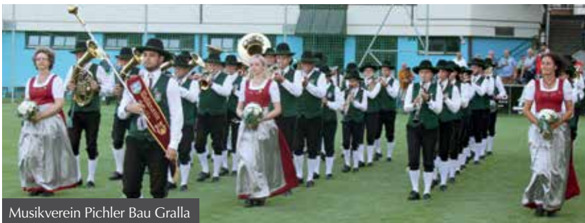
Musikverein Pichler Bau Gralla