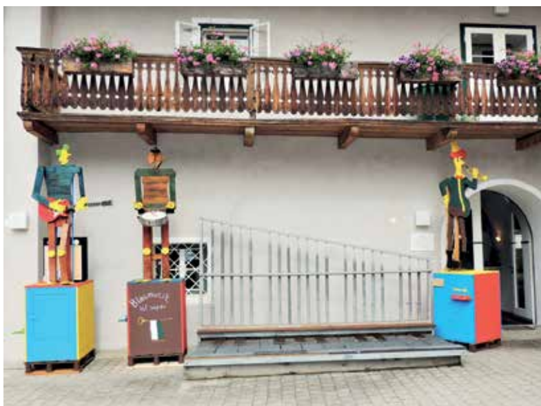
Die neue Museumscombo nach einer Idee von Dr. Bernhard Habla.

Begeisterung aufgenommen wurde. Viele der Besucher nutzten dabei die Gelegenheit, im Museum unter fachkundiger Führung die ausgestellten Exponate zu besichtigen und Wissenswertes über das österreichische Blasmusikwesen zu erfahren.