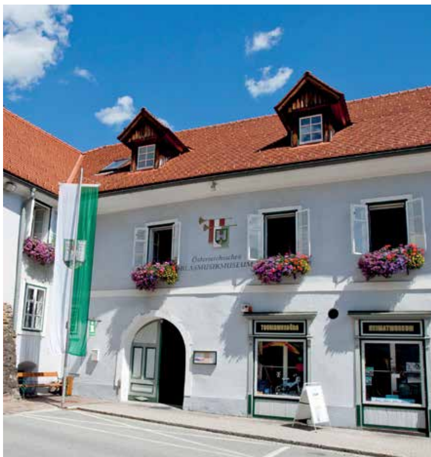
Fotos: Blasmusikmuseum Oberwölz, Rudolf Gstätter, Erzherzog Johannby Leopold Kupelwieser (wikimedia)