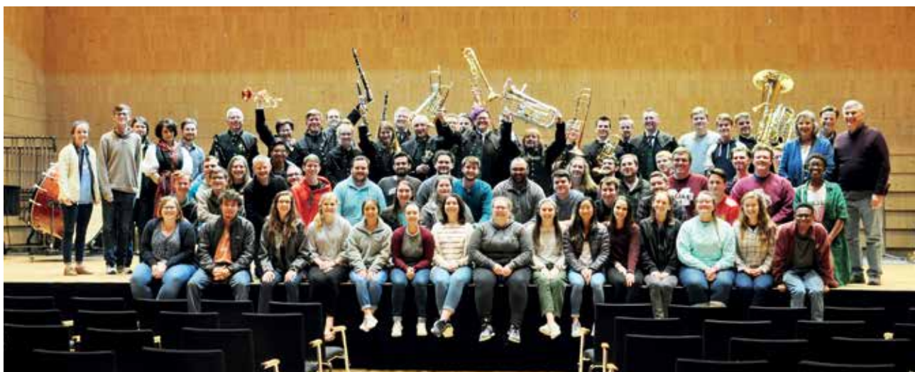
Die Traditionsmusik Arnoldstein trifft die Famous Maroon Band in Ossiach.