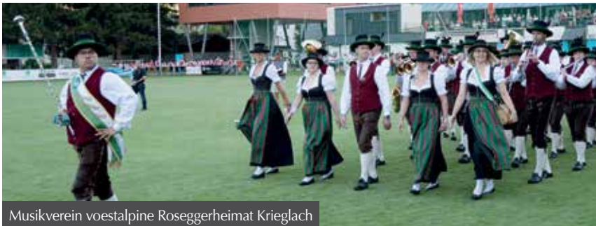
Musikverein voestalpine Roseggerheimat Krieglach