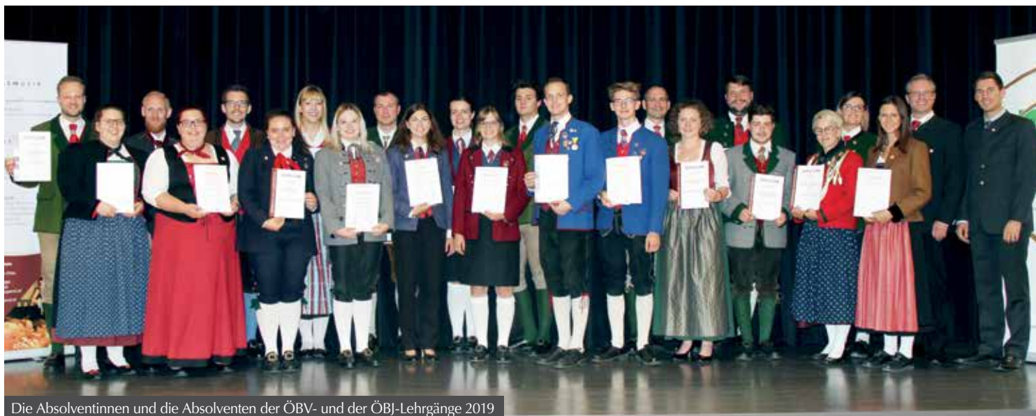
Die Absolventinnen und die Absolventen der ÖBV- und der ÖBJ-Lehrgänge 2019

Vereinsfunktionäre sind essenziell im Musikvereinswesen. Um für dieses Ehrenamt gerüstet zu sein, bieten der ÖBV und die ÖBJ diese Fortbildungsangebote an. Als diplomierter Vereinsfunktionär bzw. diplomierter Jugendreferent geht man nach einem 1-jährigen Ausbildungszyklus zu je fünf Ausbildungsblöcken hervor. Die Teilnehmer, die aus Kärnten, Niederösterreich, Oberösterreich, Salzburg, Steiermark, Tirol, Vorarlberg und Südtirol stammten, durften in diesem Zeitraum spannende Inhalte und neue Inputs rund um die Vereinsfunktionärsarbeit erfahren, Erfahrungswerte austauschen und neue Freundschaften schließen.