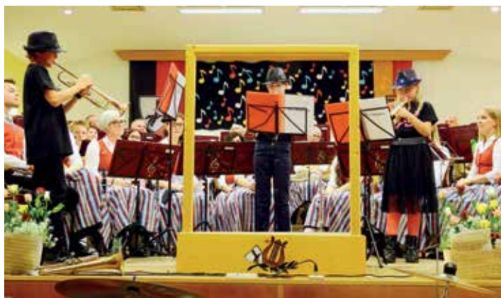
Das Trompeten-Trio „3 Maestros“ und das Schlagwerkensemble der Musikschule Dreiländereck

Gleich am darauffolgenden Morgen, dem Muttertag, durfte der Verein den ORF-Frühshoppen auf dem Campingplatz Arneitz in Faak am See musikalisch mitgestalten.