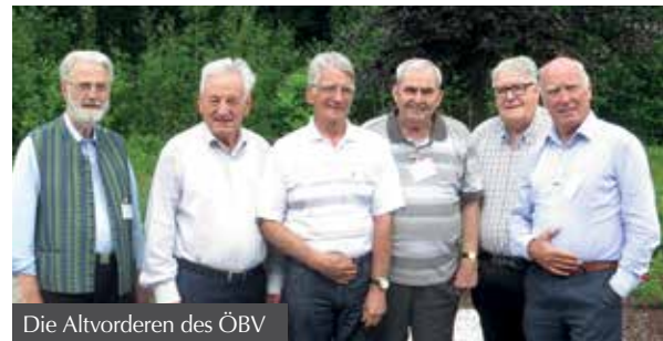
Die Altvordere des ÖBV