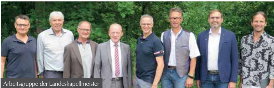
Arbeitsgruppe der Landeskapellmeister