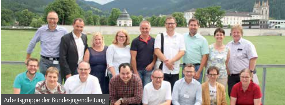
Arbeitsgruppe der Bundesjugendleitung