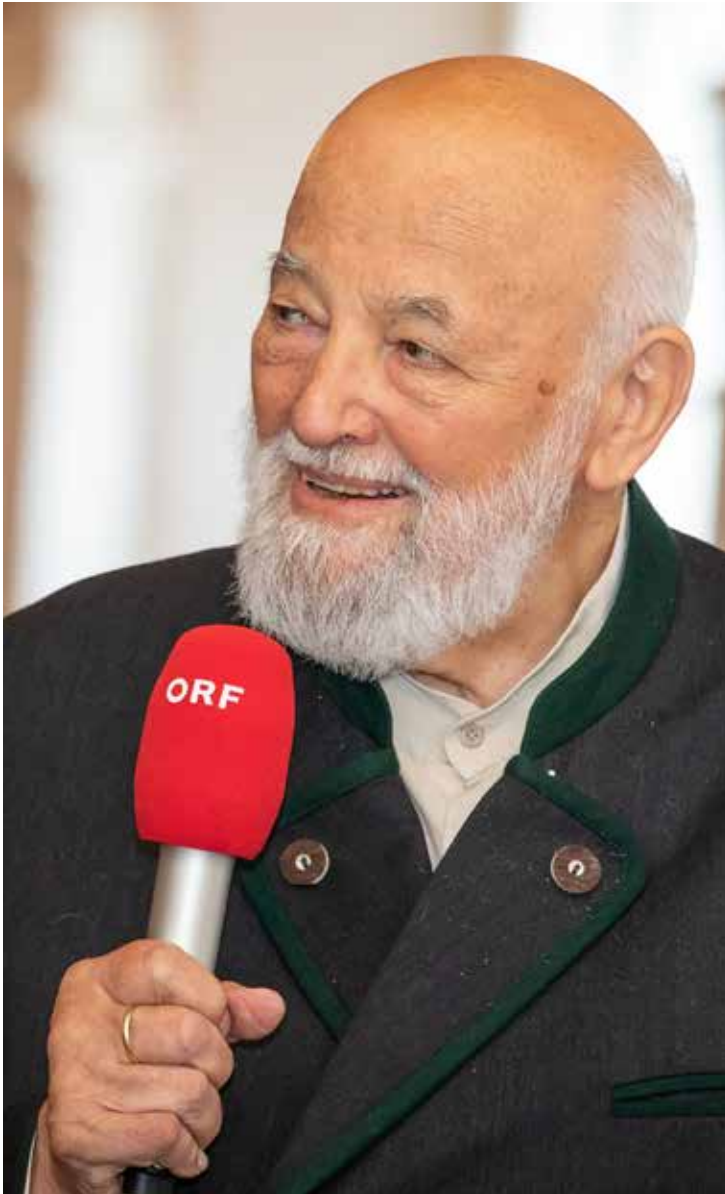
Sepp Forcher sagte nach mehr als 200 Folgen der Sendung „Klingendes Österreich“ zum letzten Mal: „Pfiat Gott beinand!“

schiedenen Salzburger Tageszeitungen mit und moderierte seit 1986 „Klingendes Österreich“. Mehr als 1.800 Volkslied- und Volksmusikgruppen sowie Blaskapellen und Schützenkompanien begleiteten Forcher bei den Wanderungen durch Österreich, Südtirol und Bayern. Die letzte und 200. Folge von „Klingendes Österreich“ wurde im Herbst 2019 während einer Reise durch ganz Österreich aufgezeichnet und am 21. März 2020 ausgestrahlt. Mit diesem Datum ging Forcher in Pension. Vor mehr als 33 Jahren begrüßte der Publikumsliebbling zum ers-