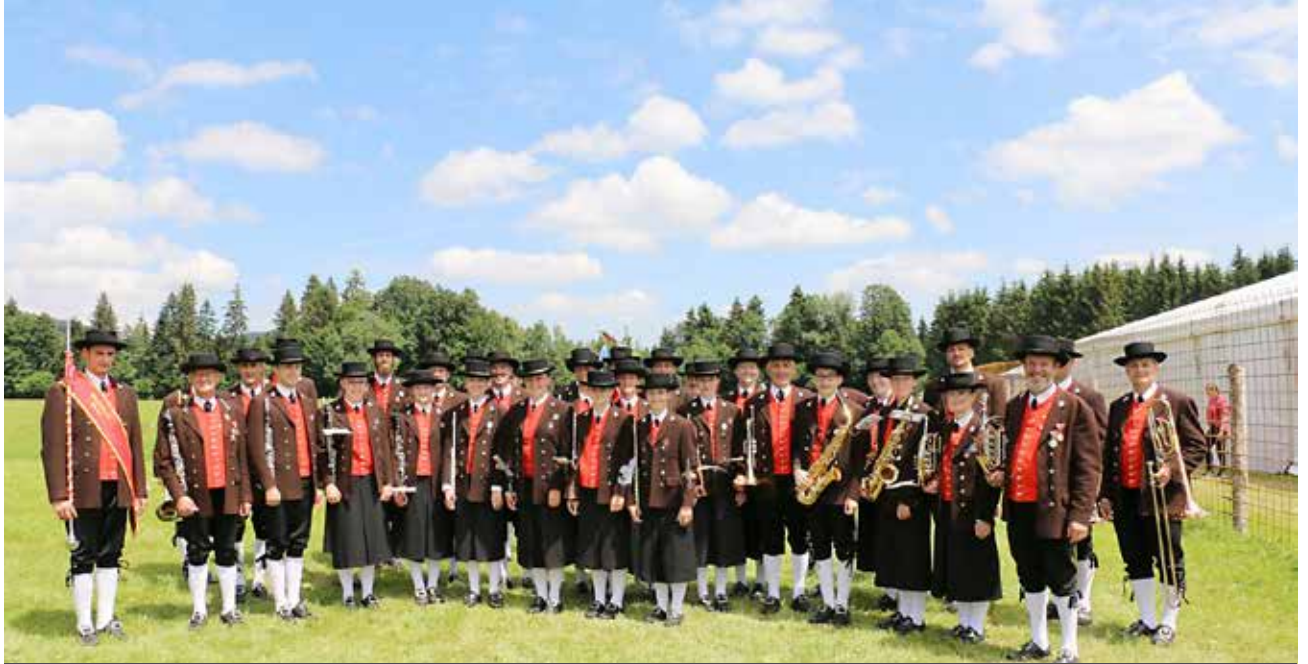
Vorstellung eines Musikvereines aus dem Blasmusikbezirk Bregenz