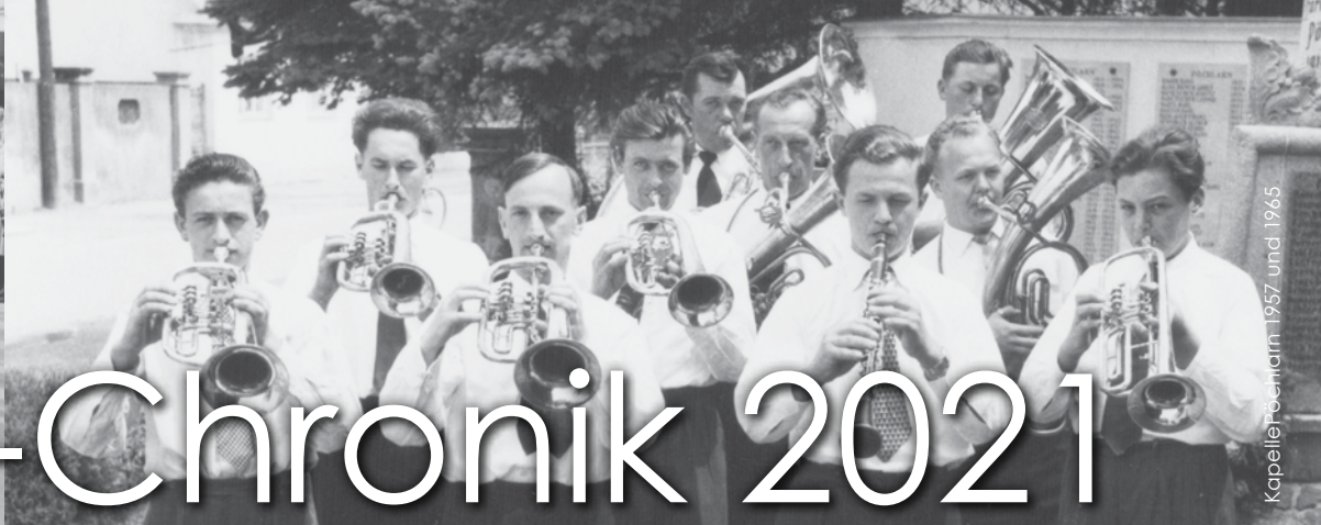
Kapelle Pöchlarn 1957 und 1965