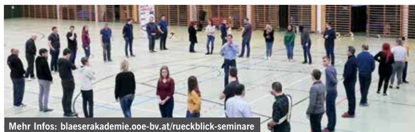
Mehr Infos: blaeserakademie.ooe-bv.at/rueckblick-seminare