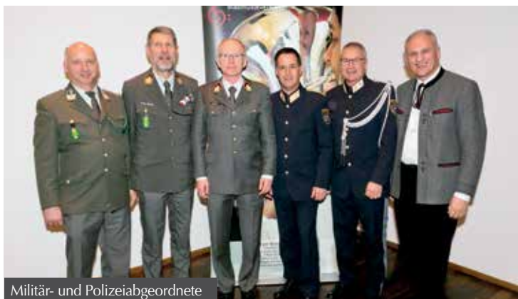
Militär- und Polizeiabgeordnete