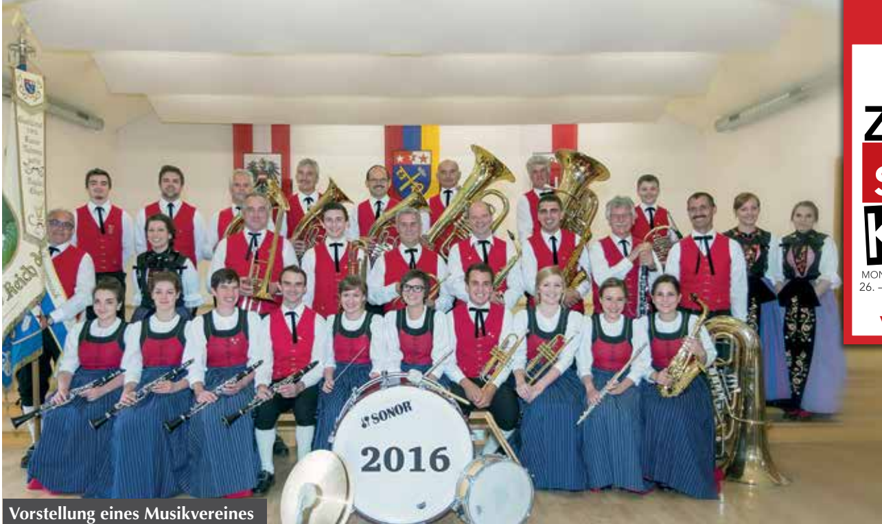
Vorstellung eines Musikvereines