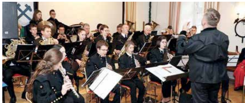
Die Traditionsmusik Arnoldstein in Vordernberg

blikum mit tosendem Applaus seine Begeisterung aus. Im Anschluss gab es noch ein Konzert des Orchesters mit Stücken wie „Böhmische Liebe“, „Na Golici“, „Pastirček“, „Veter nosi pesem mojo“, „Castles in Spain“.