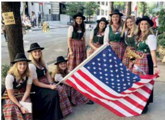
Die TMK Nußdorf am Haunsberg tourte durch Nordamerika und nahm an einer Parade durch Manhattan teil.