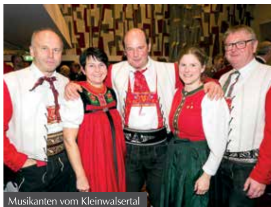
Musikanten vom Kleinwalsertal