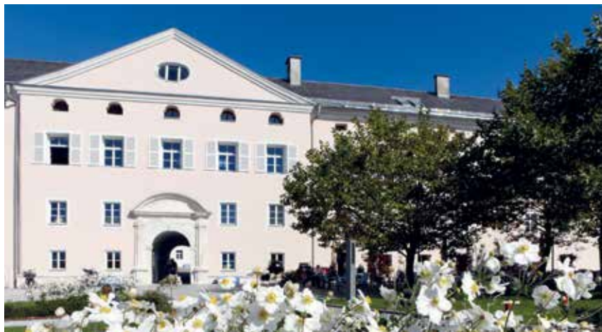
Das Stift Ossiach bietet das perfekte Ambiente für ds Blasmusikforum des ÖBV