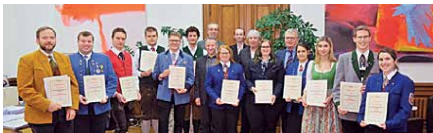
Die stolzen Absolventen des Kapellmeisterkurses