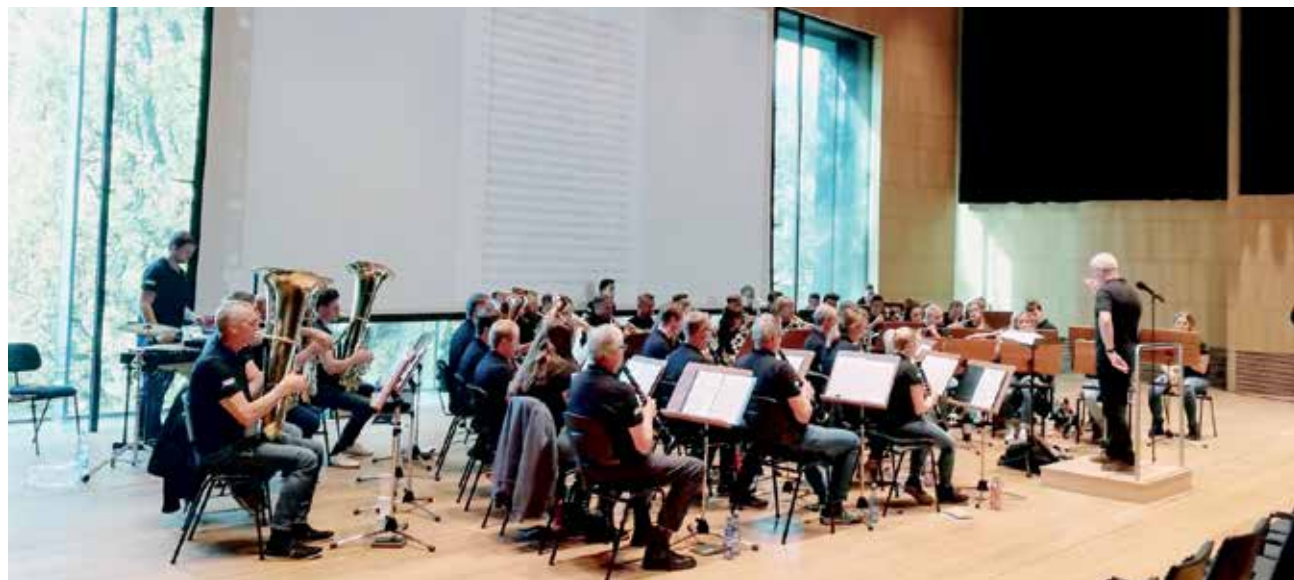
Der große Saal im Haus der Musik in Innsbruck bot ideale Bedingungen für die Probenarbeit mit der MK Trins.