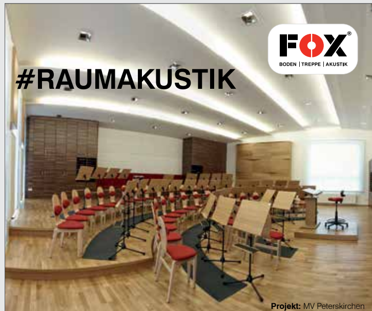
Projekt: MV Peterskirchen