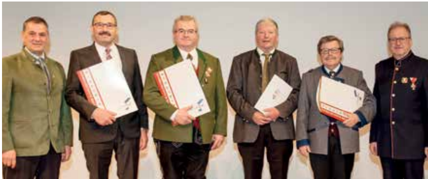
Der OÖBV ehrt verdiente Funktionäre.