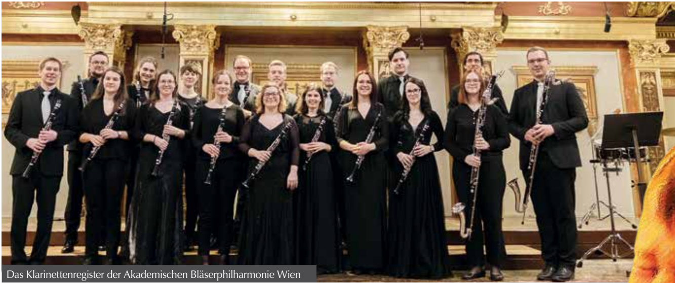
Das Klarinettenregister der Akademischen Bläserphilharmonie Wien